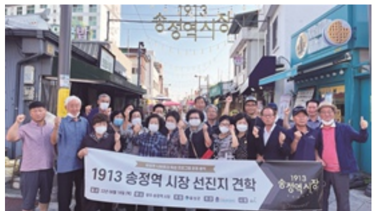
광주송정역시장 선진지 견학