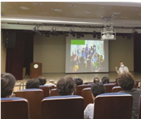
청주시 중앙동 선진지 견학 강의