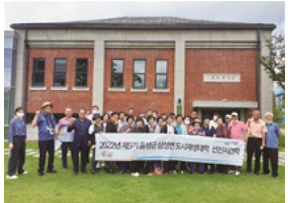
세종시 조치원읍 선진지 견학