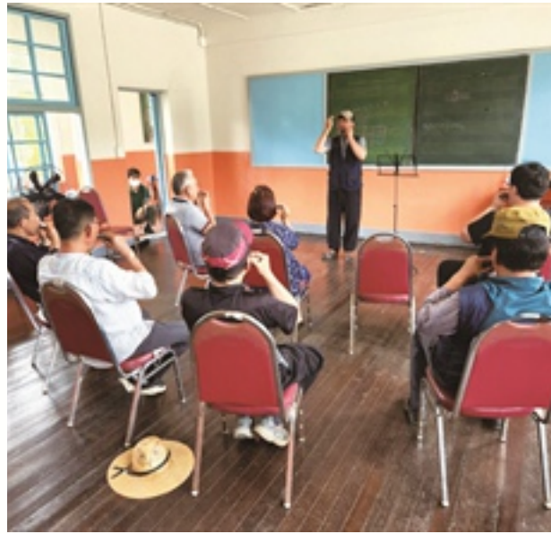
사정2리 하모니카 동아리

사정2리는 마을만들기 5억 사업에 선정되었고, 마을 주민들은 자긍심이 향상되는 계기가 되었습니다. 사정2리는 한 거리 뒤 거리(다리세기) 놀이를 캠핑장에 찾아온 주민에게 전승하고 함께하는 등 전 연령층이 참여하는 현대적 마을 놀이문화도 조성하고 있습니다. 전승과 더불어 마을의 유래인 사정(모래섬)을 복원을 진행했고, '부용연꽃마을'이라는 마을명 사용으로 마을의 뿌리까지 찾게 되었습니다. 또 '부용연꽃마을' 브랜드를 개발해 마을을 홍보하고, 수몰의 아픔이 있는 사정 저수지에 연꽃 단지를 조성해 아픔을 승화시키며 연등, 유등 행사를 통해 정신문화적 여행지로 발돋움 계획까지 세워 앞으로 한걸음 한걸음 나아갈 사정2리의 미래를 세웠습니다.