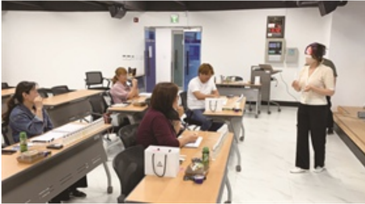
조향사 3급 자격증반