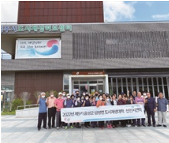
청주시 중앙동 선진지 견학

또 한편 지난 8월 18일 삼성면 도시재생 예비사업의 단위사업인 삼성면 나비효과 육성 프로그램 운영의 일환으로 광주광역시 송정역시장으로 선진지 답사를 진행하였다. 송정역시장은 과거 1913년에 개장하여 현재까지 운영되고 있는 역사적인 전통시장으로 현대카드가 '전통시장 활성화 프로젝트'를 위하여 광주시와 협력하여 시장을 리모델링하여 현재에는 젊은층에게 각광받고 있는 공간으로 탈바꿈 하였다.