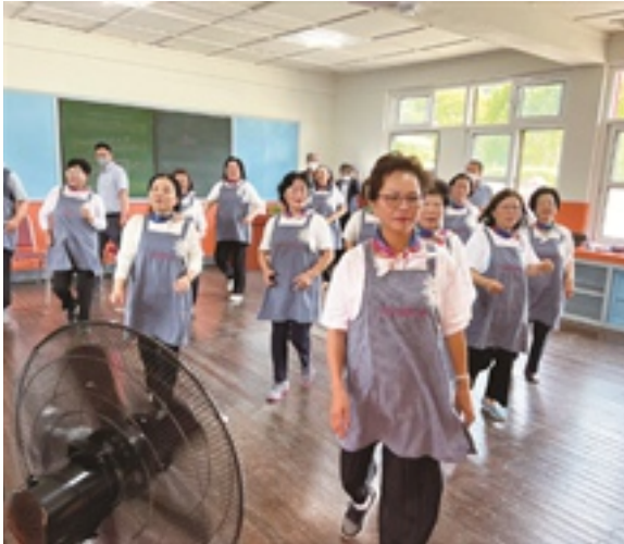
사정2리 라인댄스 동아리