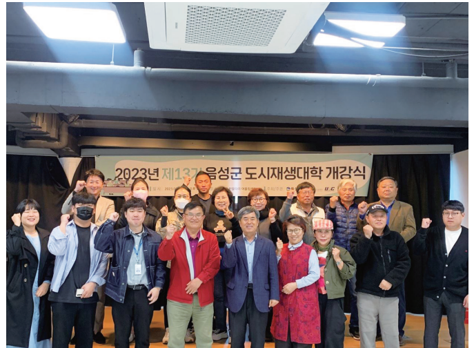
음성군 도시재생대학 개강식

도시재생대학을 통해 도시재생리더를 육성하고, 주민 주도 도시재생의 발판이 마련되길 기대합니다.