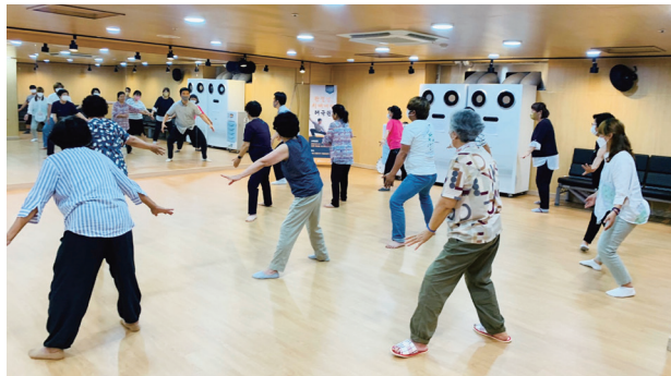
태극권·웃음 건강 체조