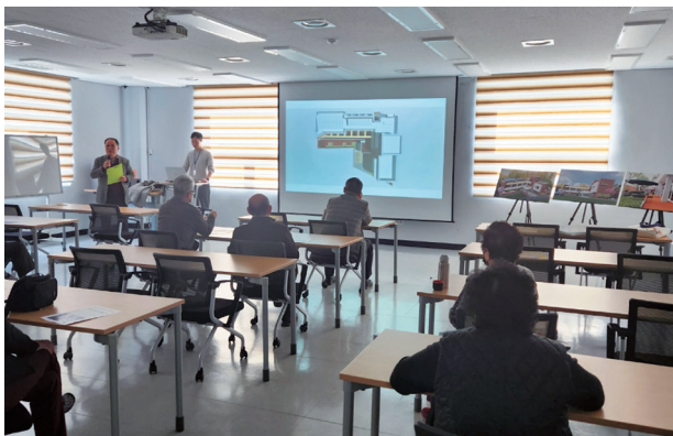
감곡 아람커뮤니티센터 조성을 위한 설명회(3월)