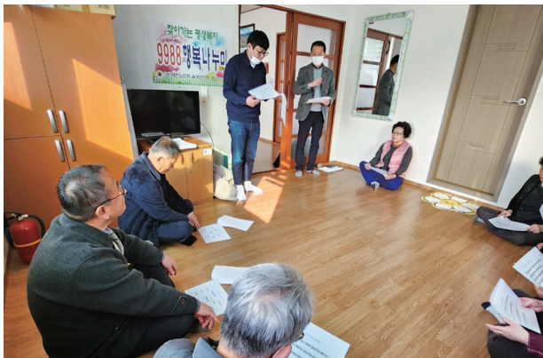
도시재생 BI 제작 설명회(2월)

5월에는 ‘마을관리 사회적협동조합 설립 및 운영’을 위한 설명회 개최를 통해 도시재생의 지속가능성 확보를 위한 도시재생 주체 양성을 지원할 예정입니다.