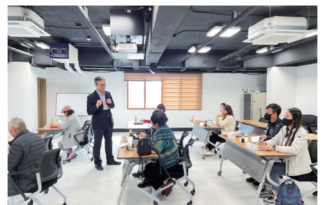
도시재생 현장활동가 양성과정(2주차)