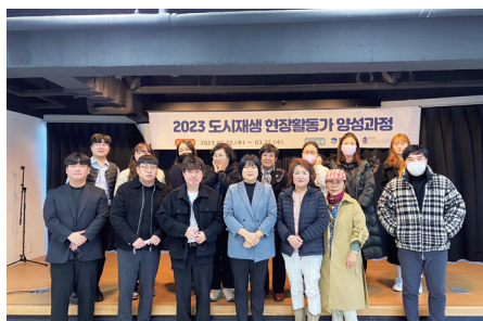
도시재생 현장활동가 양성과정(1주차)