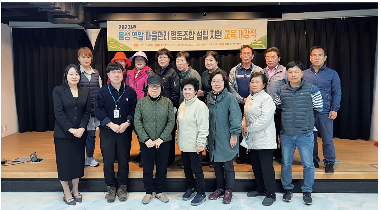
마을관리 사회적협동조합 설립 지원 교육 개강식

이번 교육을 통해 마을관리 사회적협동조합이 마중물 사업 종료 후 도시재생 추진 주체 (도시재생사업으로 조성된 거점 시설 운영 및 관리, 공동체 활성화 등) 뿐 아니라 지역활성화를 이끄는 주체로 성장하길 기대합니다.