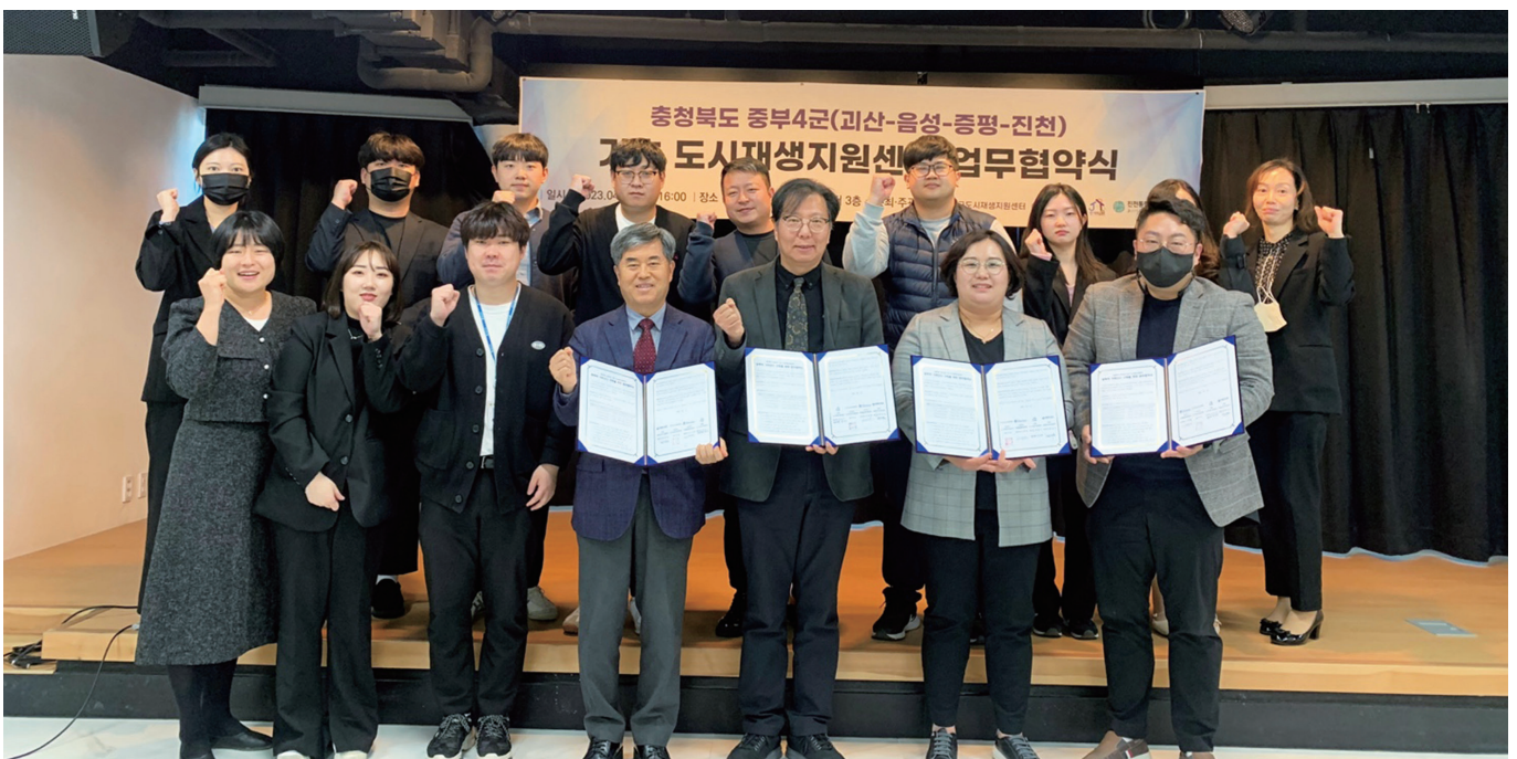
「괴산·음성·증평·진천」 도시재생 업무협약 체결