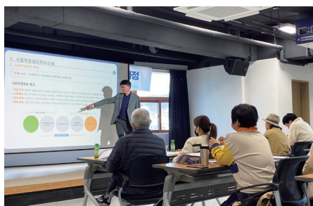
도시재생 현장활동가 양성과정(3주차)