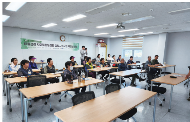
마을관리 사회적협동조합 설립 및 운영을 위한 설명회(5월)