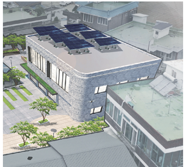
감곡 아람커뮤니티센터 조감도(안)