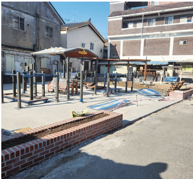
감곡 마당 조성

먼저, 주거환경 정비를 위한 ‘감곡 마당 조성 사업’입니다. 이전의 감곡 마당은 생활 쓰레기와 폐자재가 쌓여있던 공간으로 주민들의 주거환경을 위협하는 공간이었으나 현재는 운동기구와 벤치 등을 설치하여 주민들이 함께 소통할 수 있는 공원이 조성되었습니다.