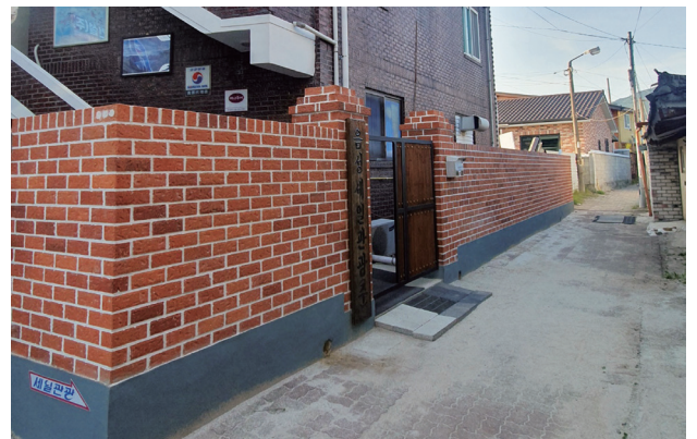
우리집 리모델링(집수리 지원) 사업 추진 후