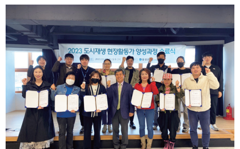
도시재생 현장활동가 양성과정(4주차)