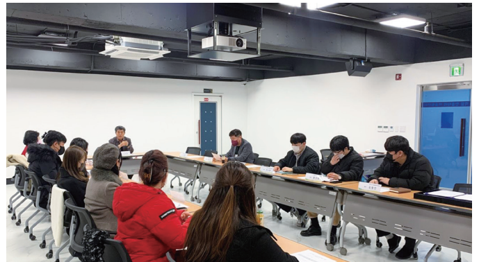
도시재생 현장활동가 위촉식

위촉식 개최 후 2월 22일~3월 22일(4주)에는 도시재생사업 현장에서의 업무수행 능력 향상을 위한 '도시재생 현장활동가 양성과정'을 운영하였습니다.