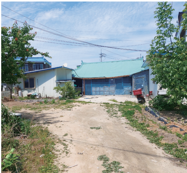
감곡 아람커뮤니티센터 조성(대상지)

하반기에는 감곡 아람커뮤니티센터, 마을회관 리모델링, 집수리 지원 사업 등 다양한 사업들이 추진될 예정으로 도시재생사업의 원활한 추진을 위해 열심히 지원하겠습니다.