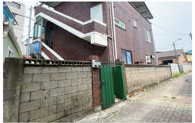
우리집 리모델링(집수리 지원) 사업 추진 전