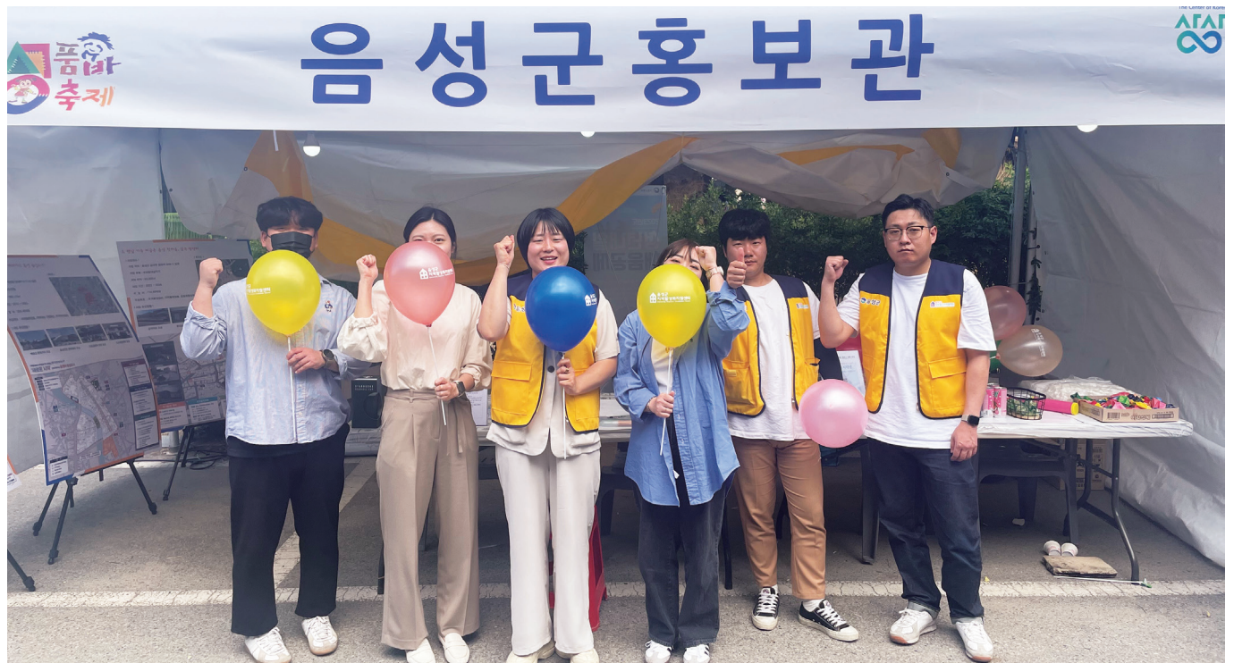
도시재생 홍보부스 운영